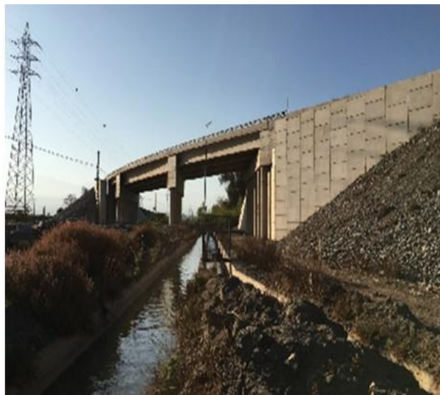
Foto 1. Canal La Pirca.