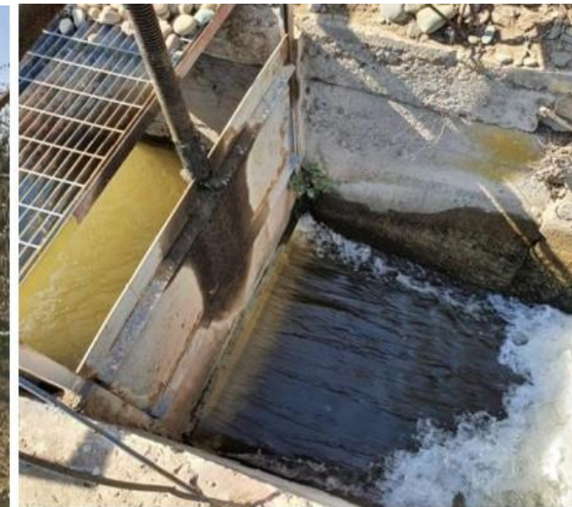
Foto 3. Canal Romeral.