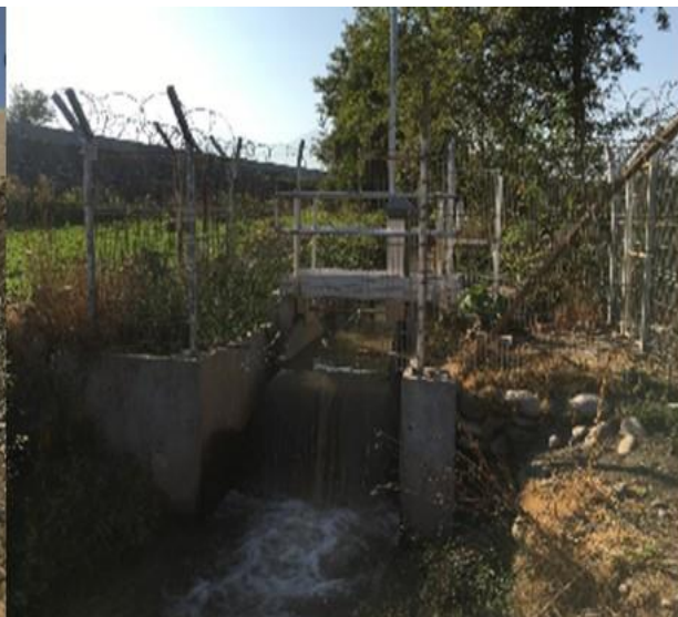
Foto 2. Canal Herrera.