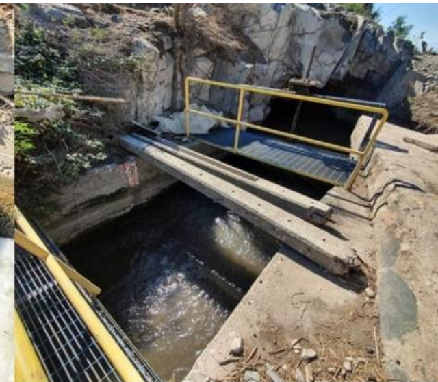
Foto 4. Canal La Sombra.